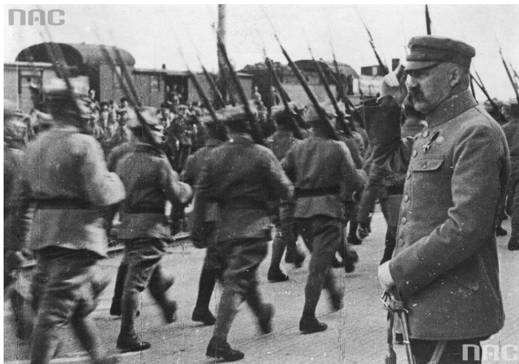
Narodowe Archiwum Cyfrowe, sygn. 22-469